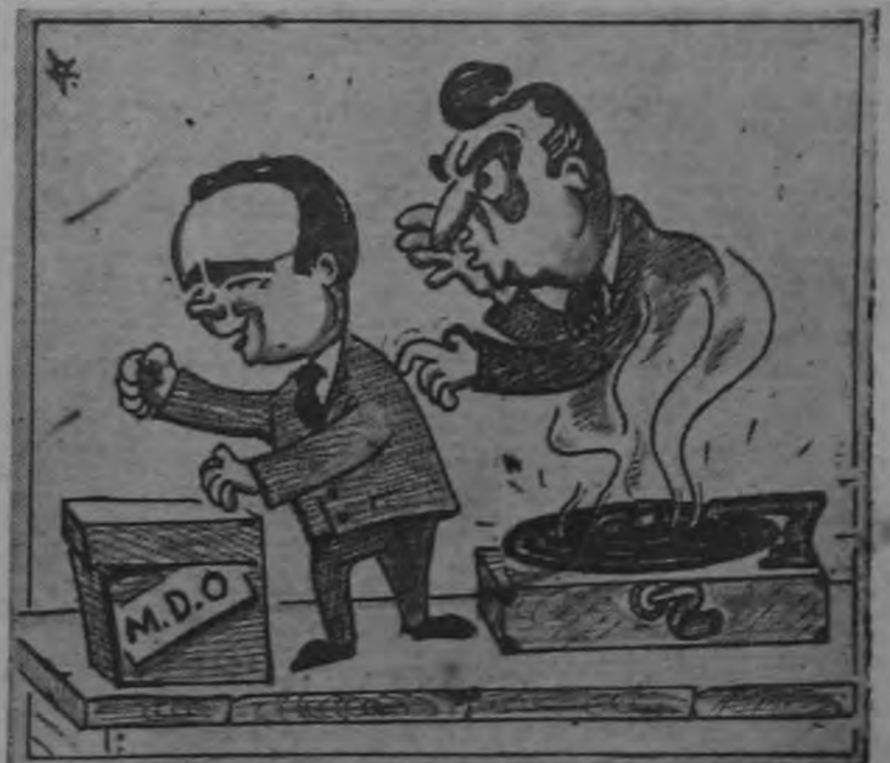
"EL OTRO 'YO' DEL DOCTOR MERENGUE"